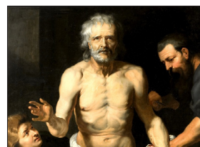
SENECA - DE VITA BEATA

La felicità, una semplice parola che in quel periodo dell'età romana sembrava impossibile e piegata al volere dell'imperatore; la felicità, da sempre meta e massimo desiderio dei filosofi, e di tutti noi, che diventa malinconia e utopia quando ormai la vita non sembra più riservarla.