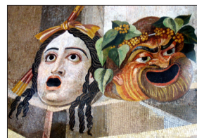
PLAUTO - CASINA (250 a.C. - 413 a. C.)

Pochi autori vennero ripresi, amati e imitati come l'arcaico Plauto, tra i massimi esponenti della commedia latina e ispiratore del teatro comico dal Rinascimento fino ai nostri giorni.