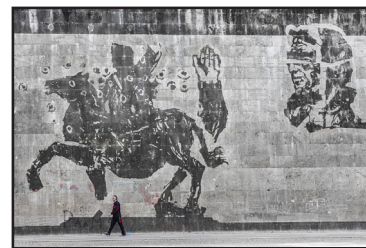
Dai murali alla street art 2. Il trionfo di Roma

Abbiamo concluso il commento precedente spiegando come una delle caratteristiche dell'arte "di strada" sia quella di colloquiare e correlarsi indissolubilmente al contesto urbano che la ospita. Abbiamo visto la natura propagandistica e nazionalista del muralismo messicano della prima metà del '900. Solitamente, l'arte su muro vuole fortemente comunicare con la realtà sociale che le ruota attorno, è legata alla città che la ospita, ai suoi abitanti, al tessuto urbano, con le sue specificità, i suoi problemi e con la sua storia. In molti luoghi d'Europa notiamo le stesse caratteristiche. Ad esempio, nei famosi murali irlandesi della città di Derry o di Belfast, sempre inerenti le problematiche del conflitto tra cattolici e protestanti. Murali dall'altissimo valore politico, sociale, comunicativo, che servono da rievocazione di fatti storici o personaggi di spicco della città o come simbolo di appartenenza politico-religiosa. Analogamente, i murali della cittadina sarda di Orgosolo trattano quasi sempre tematiche sociali o legate alla storia del territorio. La libera visibilità dell'opera d'arte, la sua capacità didattica di dialogare con la popolazione che abita quel luogo, la sua fruibilità democratica, crea opere che si intrecciano sia con la storia del luogo che con i suoi abitanti.