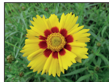
Coreopsis grandiflora "Sonnenkind"

Una piccola pianta erbacea semi-sempreverde, poco conosciuta e poco utilizzata nei giardini e nei terrazzi italiani. Coreopsis grandiflora "Sonnenkind" è una perenne caratterizzata da una ricca fioritura e un portamento compatto. Nel periodo estivo - e sino a settembre inoltrato - è in grado di produrre una notevole quantità di fiori ed è quindi ideale dal punto di vista ornamentale e paesaggistico per ravvivare le bordure miste dove ovviamente dovrà occupare un ruolo di primo piano, lasciando sullo sfondo le specie di maggiori dimensioni. I fiori sono di colore giallo intenso, a bordi frastagliati, "margherite" di medie dimensioni - si tratta d'altra parte di un esponente della famiglia delle Asteraceae - con il centro picchettato da fiammate di colore rosso vivo.