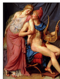
OVIDIO (Sulmona 43 a.C. - Tomi 18 d. C.)