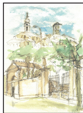
SEVERINO SPAZZINI Incisore e pittore mantovano dalla figurazione poetica

Ormai, come nella tradizione da anni instaurata dalla Associazione Pro Loco di Medole, piccolo e storico centro a un tiro di schioppo da Castel Goffredo, dove "Ratio" nasce e si realizza, i simpatizzanti del sodalizio medolese sono omaggiati annualmente da una significativa opera d'arte grafica quale segno di appartenenza e solidarietà. Va subito precisato che il sodalizio in predicato ha quale scopo primario la promozione della cultura, in generale e dell'arte, in particolare.