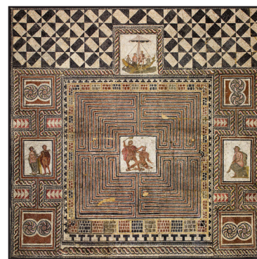
AAA: Arte - Architettura - Antichità